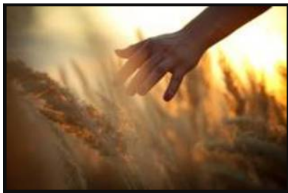
Imagem de Trigo sendo tocado

Eu vi Ele olhar para cima com um grande sorriso e Ele acenou. Ele então voltou minha atenção para a relíquia vivente do tamanho real do homem em ouro e lá eu vi exércitos. Exércitos e exércitos cercavam o campo de trigo.